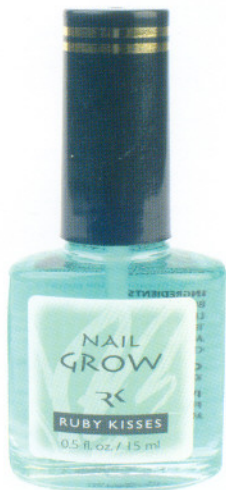
Средство для роста ногтей 15мл Nail Grow Код 14-1038

Значительно ускоряет рост ногтевой пластины, благодаря содержанию натуральных ингредиентов, таких как женьшень, зеленый чай и витаминов группы А, В и Е. Можно использовать как основу или самостоятельное покрытие.