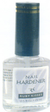
Средство для укрепления ногтей 15мл Nail Hardener Код 14-1039

Эффективное укрепление и увеличение толщины ногтевой пластины для слабых и тонких ногтей. Максимальная защита ногтей от расслаивания и шелушения. Можно использовать как основу, самостоятельное и как защитное покрытие.