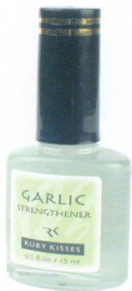
Средство для усиления ногтей с чесноком 15мл Garlic Strengthener Код 14-1043

Чеснок содержит: серу, кальций, медь, железо, магний, цинк, калий, витамины группы А, В и С, оказывает восстанавливающее действие на ногти, обладает противогрибковым эффектом. Средство для ногтей с чесноком дает усиление ногтевой пластины, восстанавливает и укрепляет чувствительные и слабые ногти. Можно использовать как основу или самостоятельное покрытие.