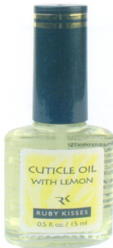
Масло для кутикулы с лимоном 15мл Cuticle Oil With Lemon Код 14-1044

Питательное масло эффективно смягчает и увлажняет кутикулу, также благотворно влияет на структуру ногтя. Из рецептов народной медицины: применение сока лимона и масла укрепляет ногти, придает им эластичность и блеск. Уникальная формула масла с лимоном от KISS укрепляет, увеличивает эластичность и стимулирует рост здоровых ногтей за счет активизации синтеза белка (кератина) и предотвращают пожелтение ногтевой пластины. Способ применения: Наносится на область кутикулы и на поверхность ногтевой пластины и втирается массажными движениями. Перед нанесением лакового покрытия необходимо обезжирить ногти.