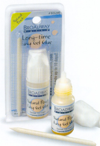
Персиковый Peach Код 14-814