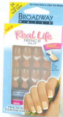
Код 14-992 BSF04 Персиковый френч