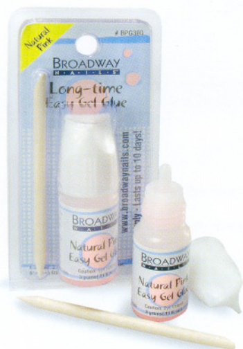
Розовый Pink Код 14-813