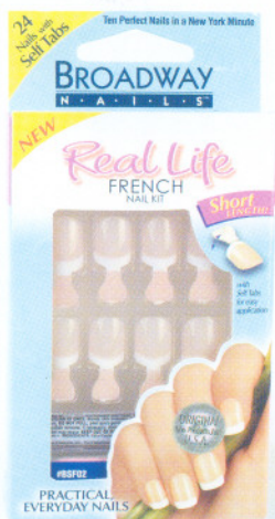
Код 14-1049 BSF02 Розовый френч